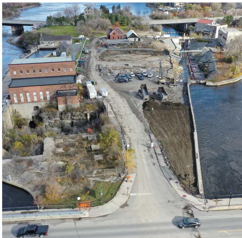
Travaux de décontamination à l'île Victoria

Depuis 2018, la CCN s'efforce de réduire les déchets occasionnés par ses activités, qui viennent essentiellement de ses bureaux; de ses travaux de démolition; et des déchets produits dans les lieux publics d'importance, lorsqu'il s'y déroule des activités. La mise en œuvre d'un programme de triage, à la patinoire du canal Rideau, a fait passer le taux de détournement des sites d'enfouissement à 80 %. Grâce à sa stratégie, la CCN continuera de réduire les déchets à ces endroits; de mettre en œuvre des mesures de réduction des déchets de construction; et de trouver des moyens de réduire les déchets à de nouveaux endroits et au cours de nouvelles activités.