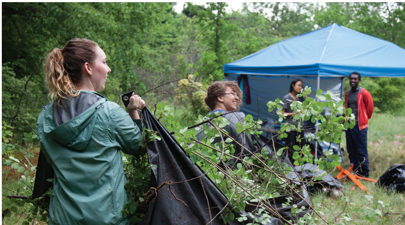
Bénévoles en train d'enlever des espèces envahissantes au lac Mud

principaux objectifs du Plan directeur du parc de la Gatineau est de préserver l'intégrité écologique du parc; le Plan directeur de la Ceinture de verdure protège quant à lui des systèmes naturels; et le Plan directeur des terrains urbains de la capitale protège des habitats naturels précieux et la biodiversité régionale des terrains urbains, et renforce le couvert forestier en milieu urbain. Parmi les programmes et activités de la CCN qui visent à préserver la biodiversité et à réduire la fragmentation des habitats, il y a la mise en œuvre de plans d'intégration d'espèces en péril; le projet de gestion responsable des sentiers; le Plan d'action sur les ressources naturelles; la protection des corridors écologiques; la gestion des espèces envahissantes et divers projets de restauration des berges. Les mesures énoncées dans cette stratégie seront surtout axées sur la mesure des progrès réalisés par la CCN en matière de protection des corridors écologiques adjacents au parc de la Gatineau et sur l'impact qu'ont les espèces envahissantes sur les terrains de la CCN.