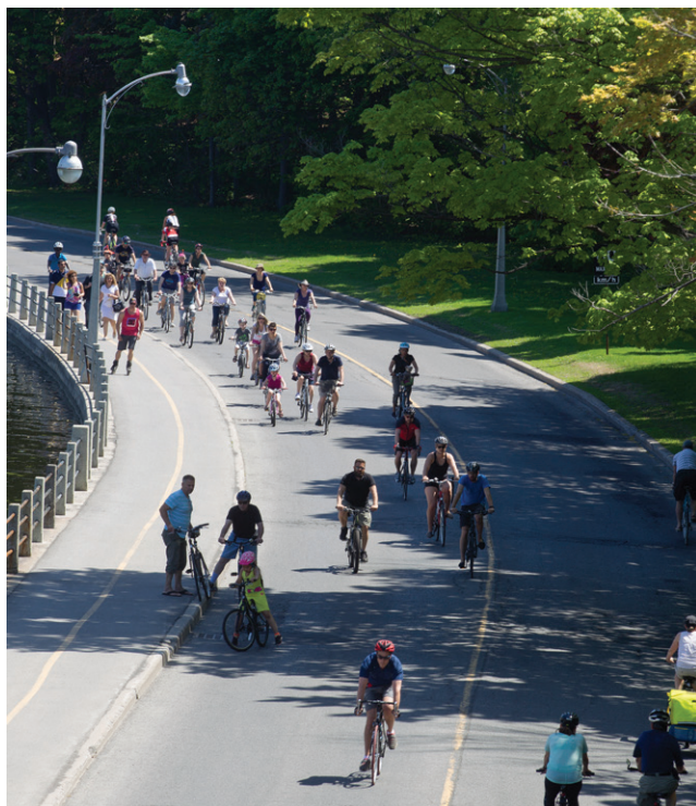
Promenade du Colonel-By

Pour investir dans la durabilité à long terme des villes et le bien-être des collectivités, il est nécessaire de prendre en compte de multiples facteurs qui se chevauchent, notamment l'accès au logement abordable, au transport public et aux espaces verts, ainsi que la préservation du patrimoine – bâti, culturel et naturel. En tant qu'intendante du patrimoine naturel et culturel et planificatrice à long terme de la région, la CCN cherche à cultiver un environnement qui favorise le bien-être de la population et procure une vision de la durabilité pour la région. Elle s'engage à améliorer l'infrastructure (réseau de transport, logement abordable, etc.) ainsi qu'à aménager des espaces verts accessibles (ou les améliorer), afin de rendre la région de la capitale nationale plus durable et plus agréable.