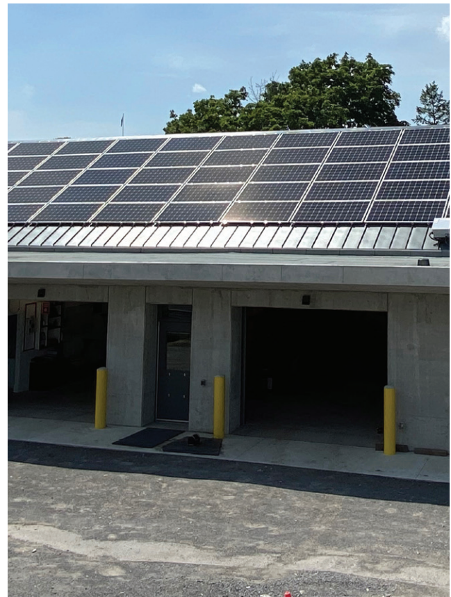
« La Grange », une nouvelle construction carboneutre à Rideau Hall

Pour écologiser ses activités, la CCN mettra en œuvre des mesures pour les plus importantes d'entre elles, c'est-à-dire là où les bienfaits pour l'environnement sont susceptibles d'être les plus grands. Ces mesures comprendront : l'assurance que ses espaces verts fourniront encore longtemps de précieux services écosystémiques; une meilleure gestion des terres boisées; l'adoption de méthodes à faibles émissions de carbone et écosensibles, pour l'entretien de ses terrains; la réduction du nombre de collisions d'oiseaux, dans les fenêtres des bâtiments de son vaste portefeuille; et la promotion de modes de déplacement durables auprès de son personnel.