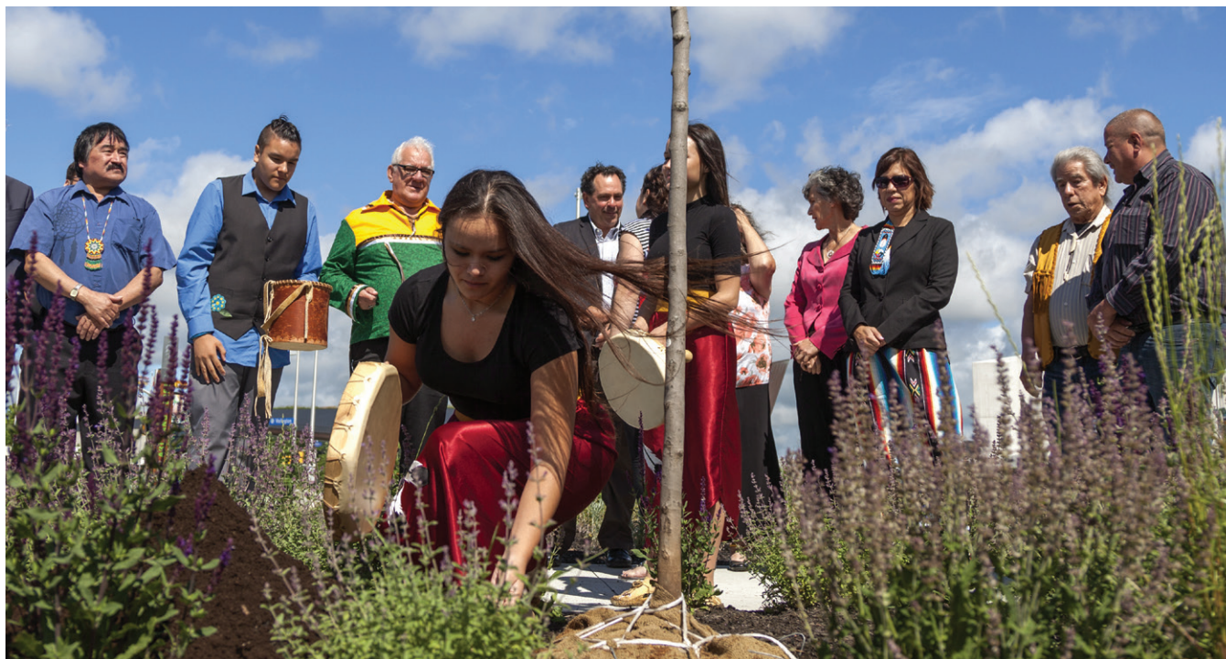
Cérémonie d'ouverture au parc Pindigen

reflètent réellement dans nombre de projets et idées proactives entrepris dans la région de la capitale nationale. Au cours de la période visée par la SDD, la CCN continuera de faire progresser la réconciliation, notamment au moyen de sa politique sur la toponymie, laquelle prévoit l'adoption d'un processus décisionnel transparent pour nommer ou renommer les actifs gérés par la CCN ainsi que la formation d'un comité consultatif sur la toponymie, dont font partie des partenaires de la Première Nation Kitigan Zibi Anishinabeg et des Algonquins de la Première Nation Pikwàkanagàn, ainsi que des spécialistes de l'histoire de la région et du Canada. La CCN continuera d'améliorer ses relations dans le cadre de projets visant précisément la réconciliation, tels que l'école de fouilles archéologiques Anishinàbe Objibikan et les grands projets de construction dans la région de la capitale nationale, comme le réaménagement de la pointe Kiweki (l'ancienne pointe Nepean) et la réhabilitation de l'île Victoria.